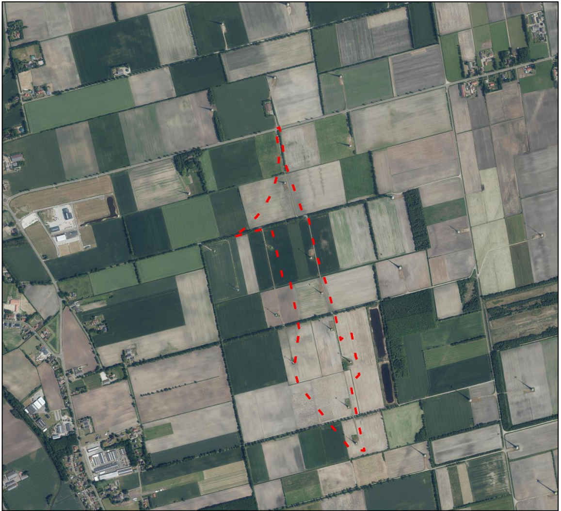
Abb. 1: Luftbild und Lage des Plangebietes (rote Umrandung) (unmaßstäblich).