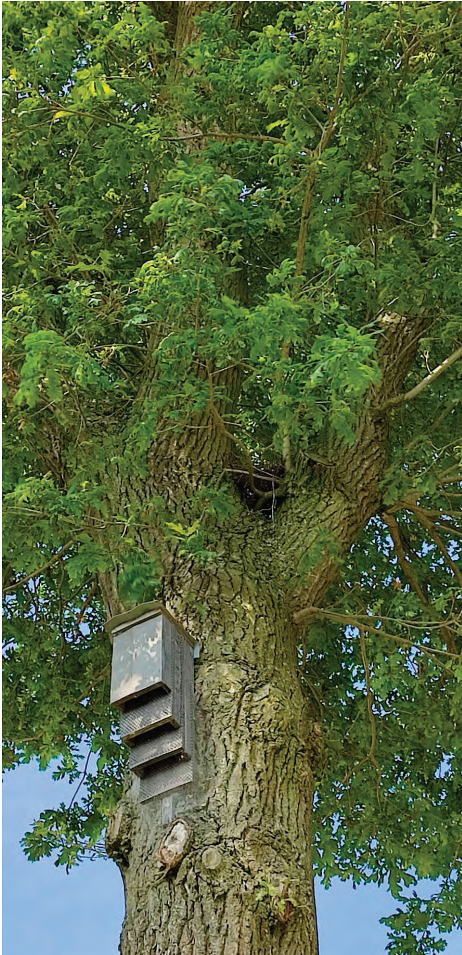
Abbildung 5 Struktur und Zustand der Eichen 3 (Fledermausquartier)