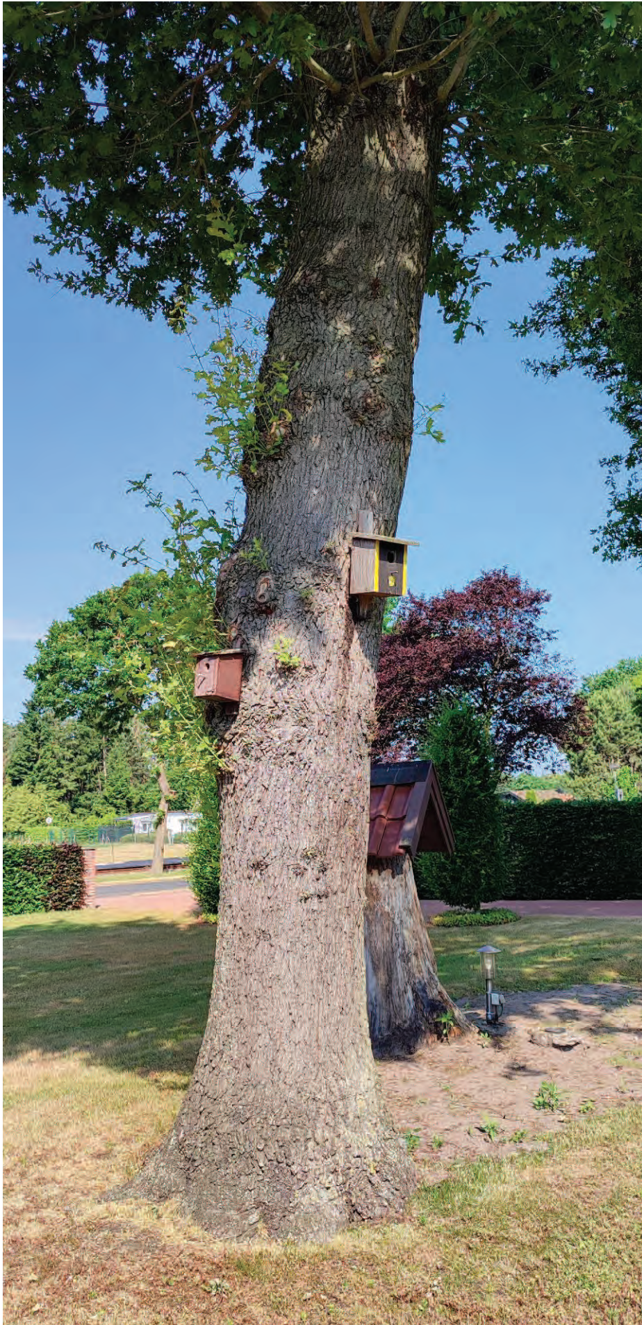
Abbildung 4 Struktur und Zustand der Eichen 2 (Vogelnistkästen)