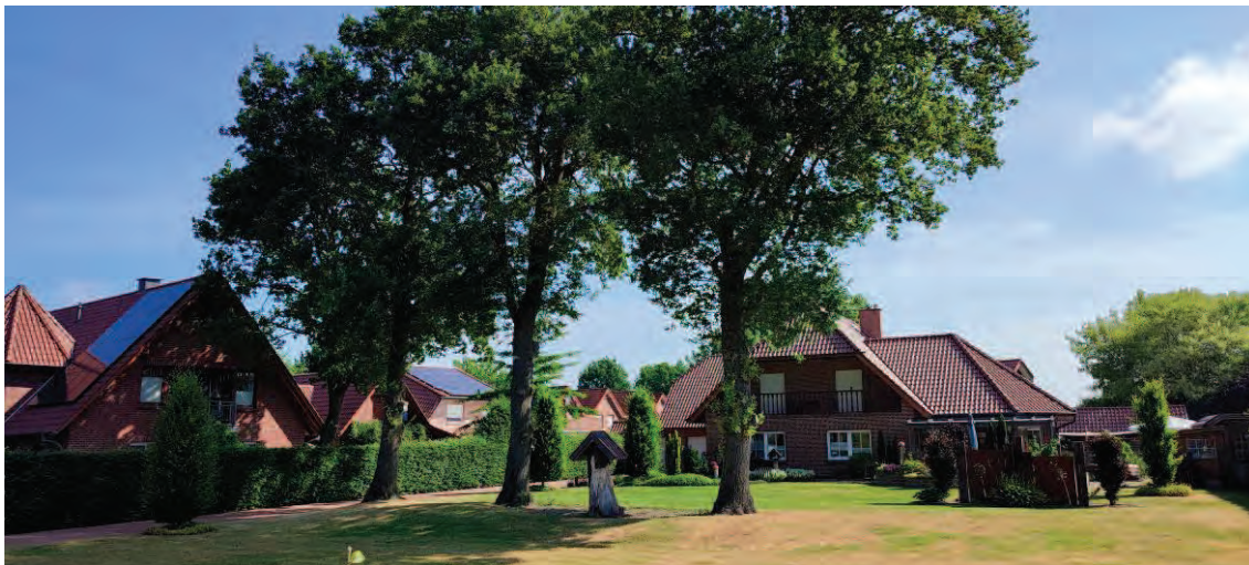
Abbildung 2 Übersicht über die Eichengruppe von Westen