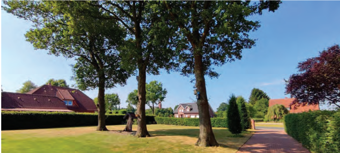
Abbildung 1 Übersicht über die Eichengruppe von Osten